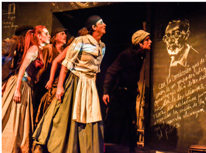
Balada Del Pobre BB / Impulso Teatro / Dirección: Alexis Díaz de Villegas