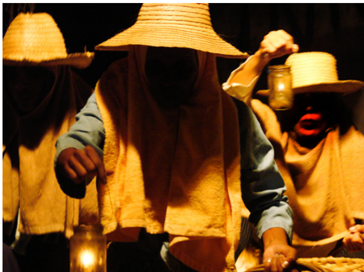
Iniciación en blanco negro para mujeres sin color / Estudio Teatral Macubá / Dirección: Fátima Patterson