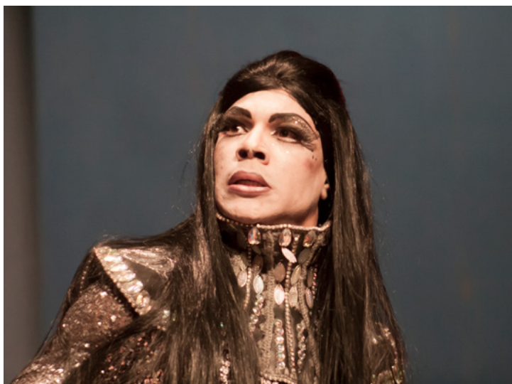
Harry Potter se acabó la magia / Teatro El Público / Dirección: Carlos Díaz / Actor: César Domínguez